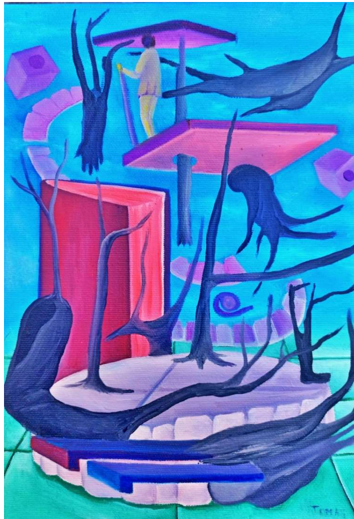
Tomás Mendoza. La planta dentada , 2024. Óleo, 27x19cm.

es mi compañera de viaje a la que siempre me puedo cobijar el ritual de pintar es algo que disfruto como si fuera la última vez.