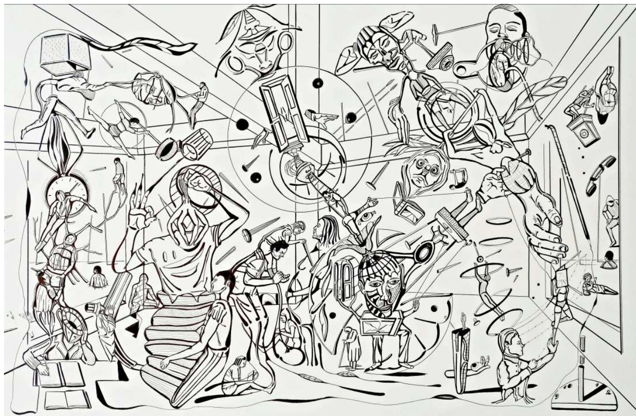
Tomás Mendoza. Caos , 2017. Tinta sobre papel, 65x100cm.

PAC – Defínete mediante hashtags o etiquetas.