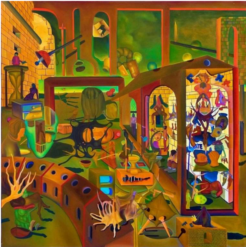
Tomás Mendoza. El viajero de la noche , 2016. Óleo, 200x200cm.

PAC – ¿Qué deberíamos aportar y eliminar al Sistema?