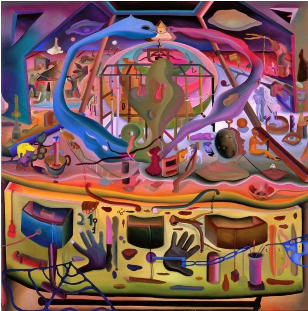
Tomás Mendoza. La lucha, 2006. Óleo, 130X130cm.