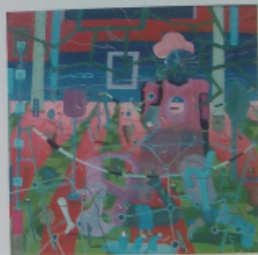
El descanso , 2003. Óleo/tabla. 35 x 34 cm.