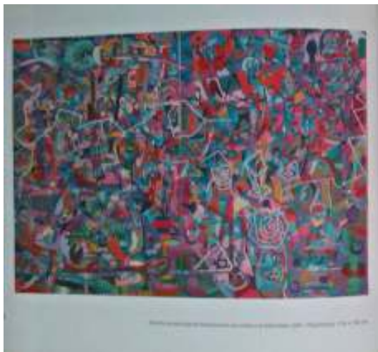
Vito Barandiarán, Abstracción , 1964, óleo sobre tela.

En esta pintura se evidencia la capacidad de la abstracción de expresar, a través de un lenguaje visual, una gran variedad de sentimientos y estados de ánimo, así como la capacidad de la abstracción de ser un lenguaje universal, capaz de trascender las barreras del tiempo y del espacio.