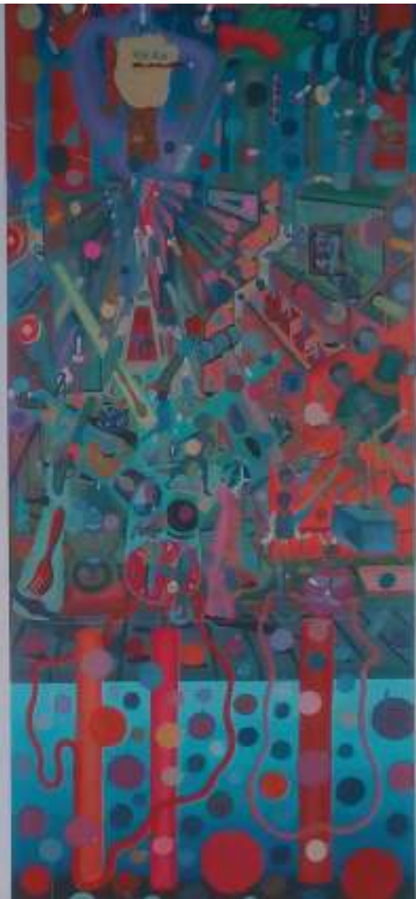
Passeje en perspectiva, 2003. Oleofuturo. 190 x 84 cm