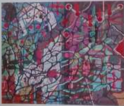
32 Fin del homo sapiens, 2000. Óleo sobre lienzo. 81 x 100 cm.

Premio de Pintura Aldeasa 2001. Semifinalista. Madrid. Primer Premio IV Certamen de Pintura de José María Parraga. Mención de honor. Certamen de jóvenes creadores del Ayuntamiento de Madrid.