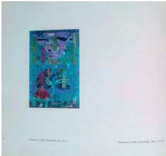
Roberto Gatti, Abstracción , 1964, óleo sobre tela.

Abstracción, óleo (detalle), 1964, 17 x 17 cm.