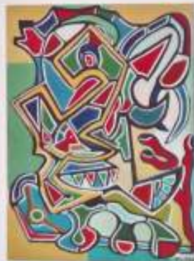
Génesis de colores de un animal muerto, 1999. Óleo sobre lienzo. 73 x 54 cm.