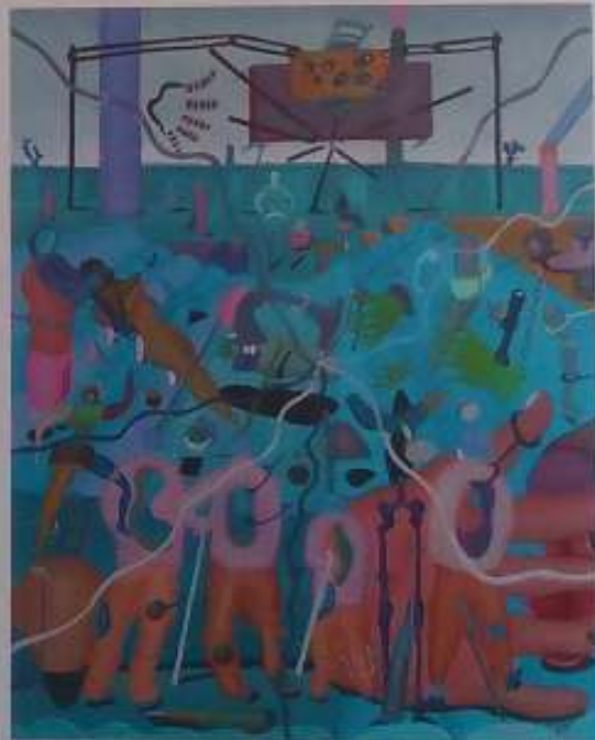
El mirador , 2003. Óleo/tabla. 32 x 26 cm.