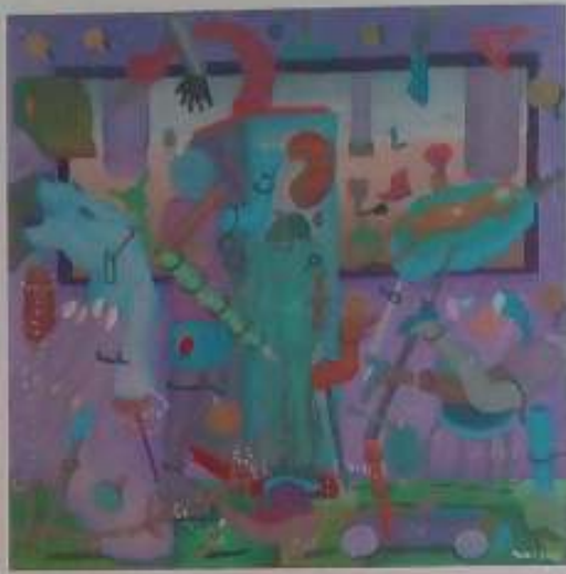
La cornada , 2002. Óleo/tabla. 27 x 27 cm.