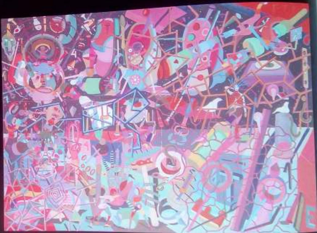
30 Saboreando mi imperfección, 2001. Oleotabla. 105 x 135 cm.