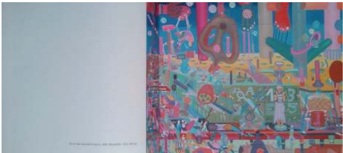
El nacimiento, 2001. Oleo sobre tela, 107 x 92 cm.