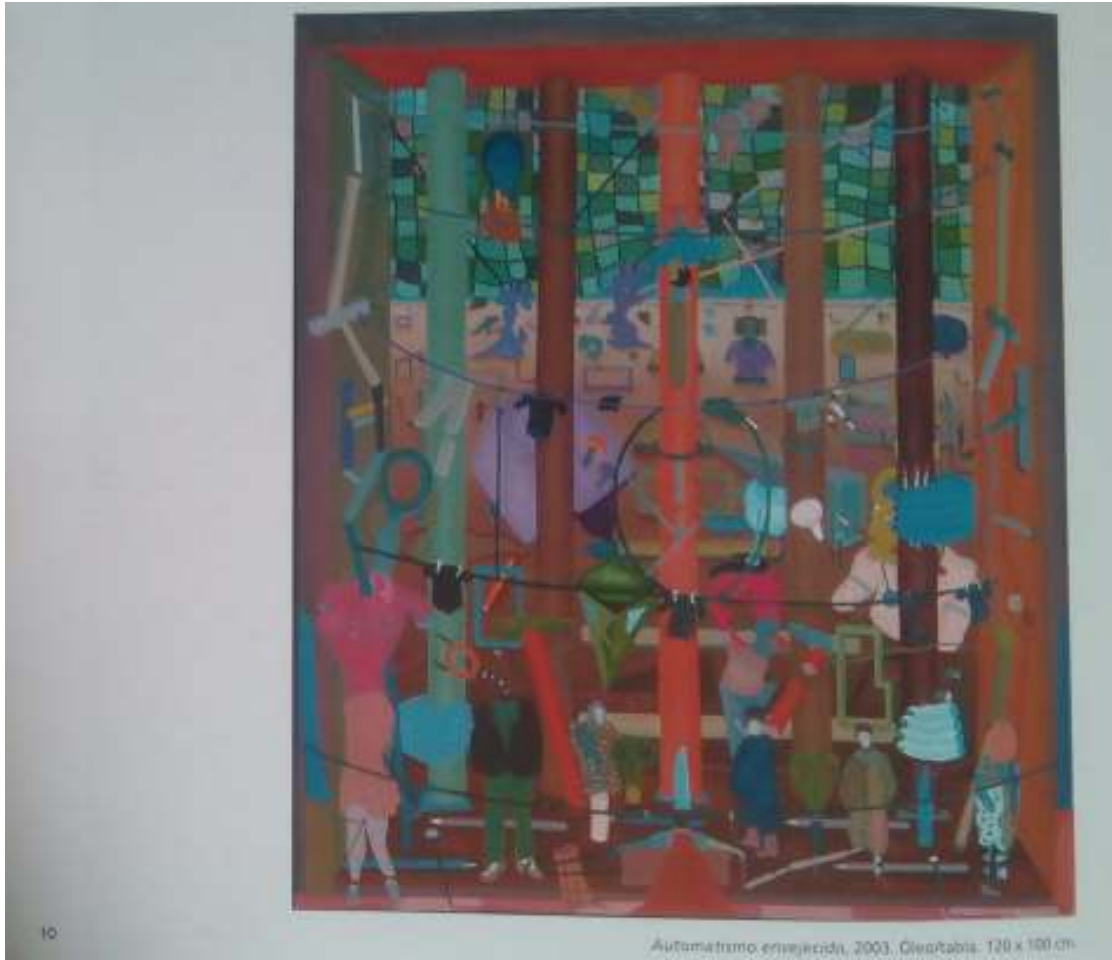
Automatismo enajenado, 2003, Óleo/tabla. 120 x 100 cm