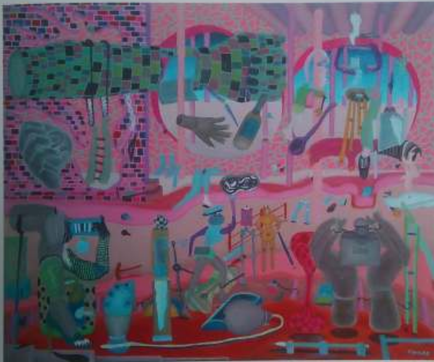
El perfume, 2003. Óleo/Tabla, 56 x 67 cm.