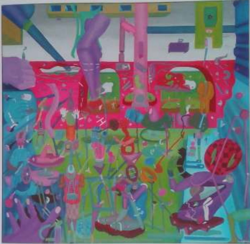
Mesa suladora, 2003. Óleo sobre tela, 80 x 82 cm