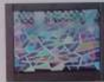
El olímpico, 2003. Óleo sobre lienzo. 12 x 17 cm.