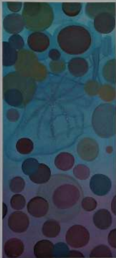
La araña, 2003. Óleo/lienzo: 81 e 35 cm.

El esfuerzo, su esfuerzo, está en colocarse a la intemperie; delante del lienzo y dejarse atravesar por la luz, y descubrir, entender, aceptar, lo que ha quedado impreso en la tela; el esfuerzo, su esfuerzo, se manifiesta en trasladarnos, mostrarnos el resultado, su complejidad, porque esa condición es, precisamente, la verdadera tarea de la poesía, de la pintura, exponer la complejidad, luchar contra las simplificaciones.