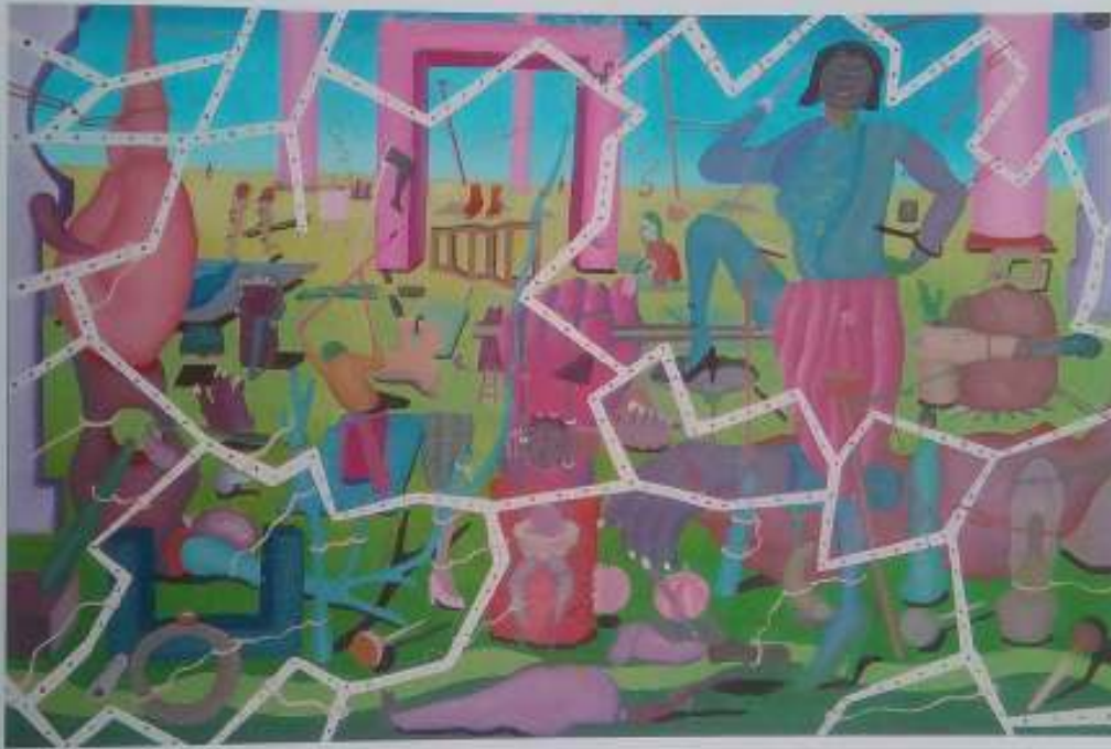
El pincel tónico , 2003. Óleo/tabla. 39 x 58 cm. 17