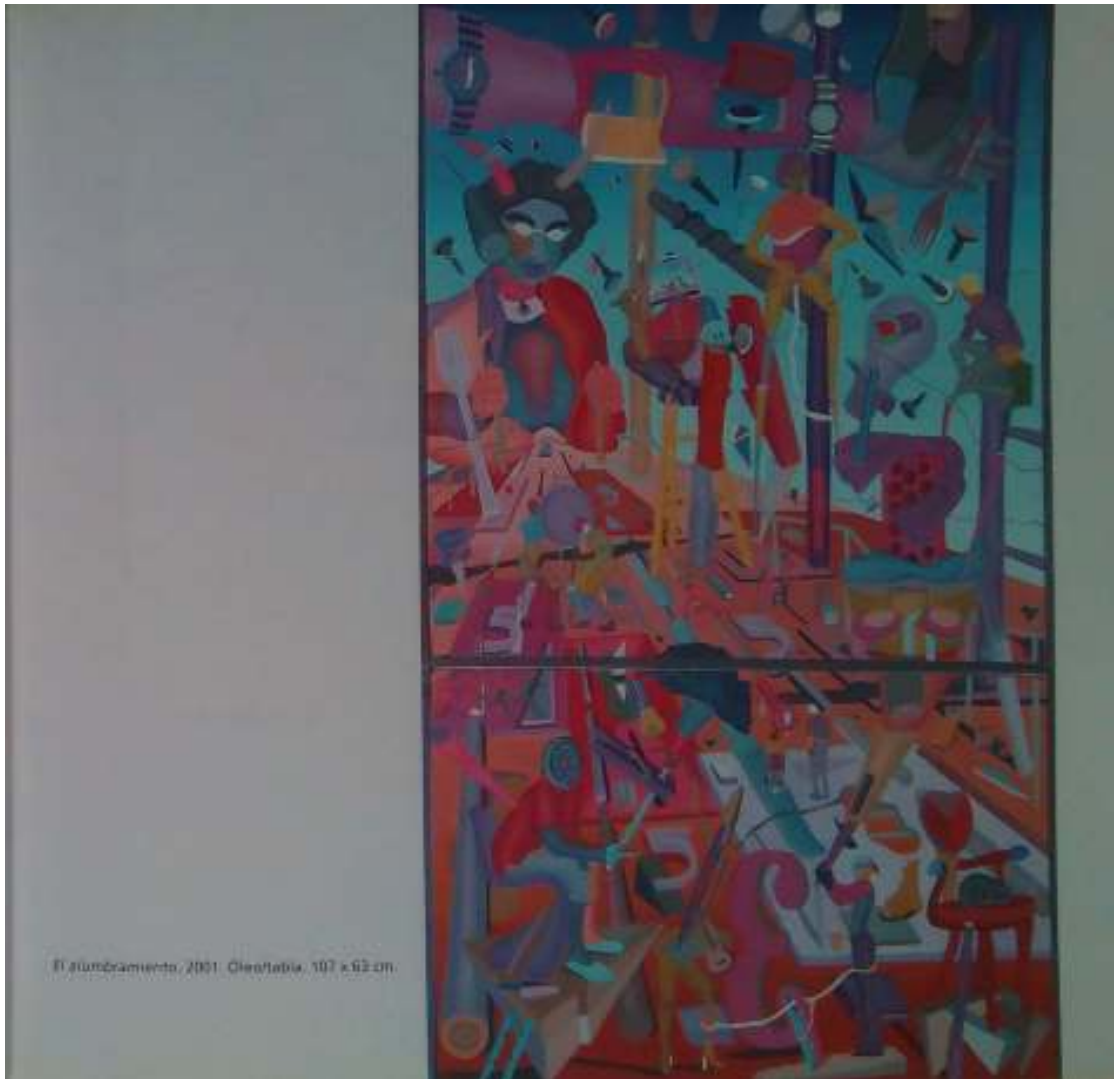
El alumbramiento, 2001. Oleo sobre tela, 107 x 92 cm.