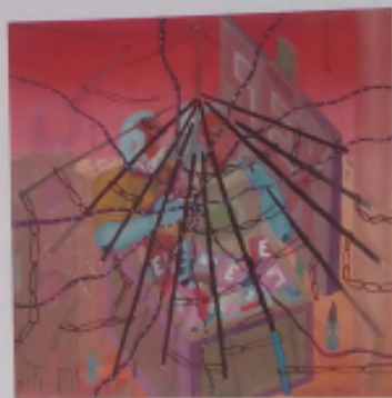
El deseo , 2003. Óleo/tabla. 25 x 25 cm.