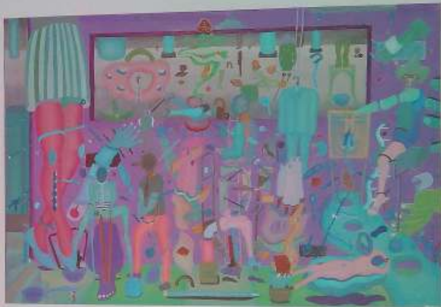
La ventana, 2003. Oleotabla. 52 x 75 cm. 29