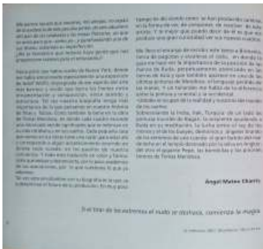
El día de los muertos en el estado de México, comienza la fiesta

En esta pintura se evidencia la capacidad de la abstracción de expresar, a través de un lenguaje visual, una gran variedad de sentimientos y estados de ánimo, así como la capacidad de la abstracción de ser un lenguaje universal, capaz de trascender las barreras del tiempo y del espacio.