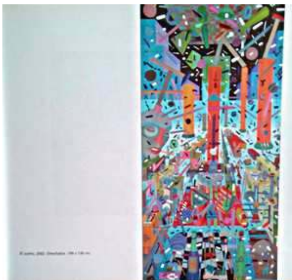
El camino, 2002. Óleo/lienzo: 100 e 100 cm.

Martín Lejarraga , Cartagena, febrero de 2004